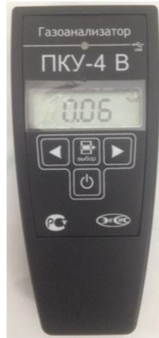
в) исполнение ПКУ-4 В-П-Д