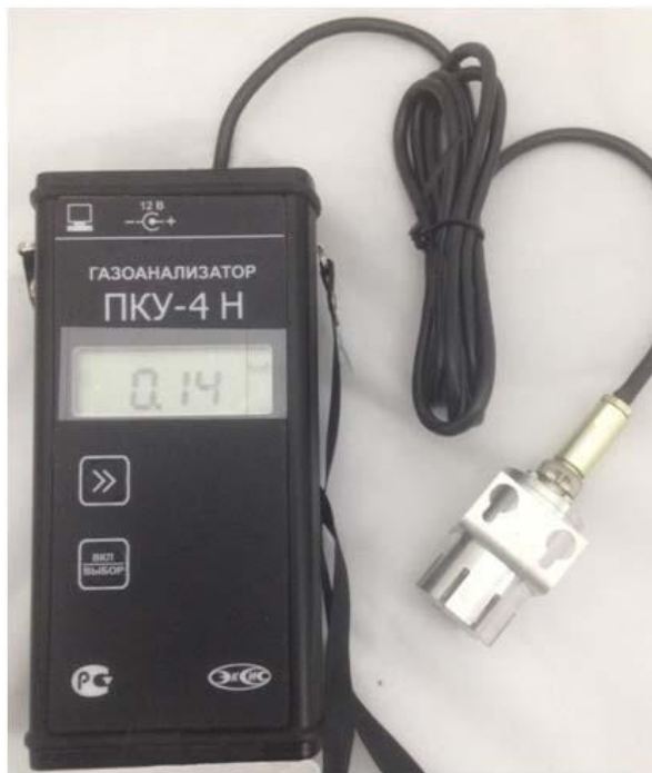
а) исполнение ПКУ-4 Н-М