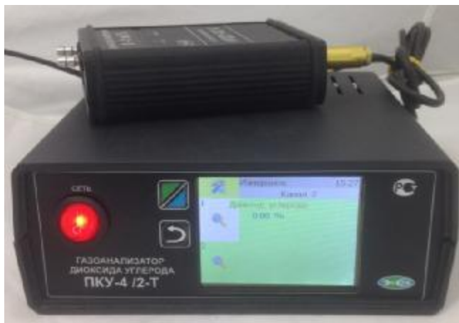
г) исполнение ПКУ-4 /2-Т (двухканальный, на фото показан только один измерительный преобразователь)