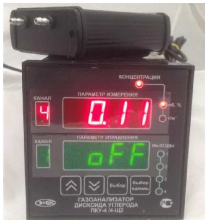
б) исполнение ПКУ-4 /4-Щ2 (четырёхканальный, на фото показан только один измерительный преобразователь)