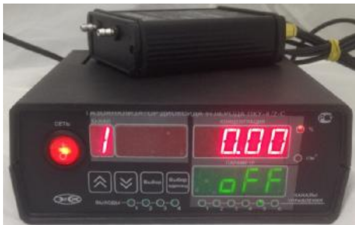
в) исполнение ПКУ-4 /2-С (двухканальный, на фото показан только один измерительный преобразователь)