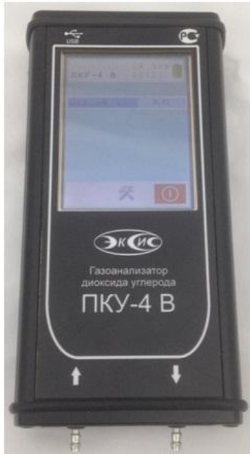
в) исполнение ПКУ-4 В-М-Т