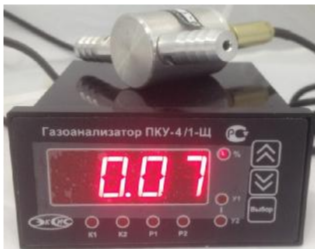
а) исполнение ПКУ-4/1-Щ (одноканальный)