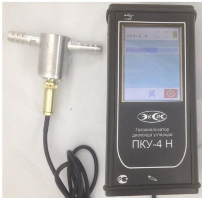
в) исполнение ПКУ-4 Н-М-Т