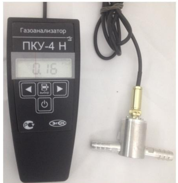
б) исполнение ПКУ-4 Н-П