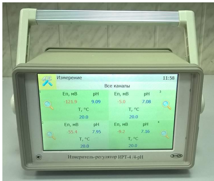
Рисунок 5 - Общий вид измерителя-регулятора ИРТ-4 /Х-pH, исполнение ИРТ-4 /4-pH