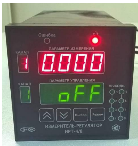
Рисунок 2 - Общий вид измерителя-регулятора ИРТ-4/8