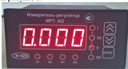
Рисунок 1 - Общий вид измерителя-регулятора ИРТ-4/2

Схема пломбировки от несанкционированного доступа, обозначение места нанесения знака поверки представлены на рисунке 6.