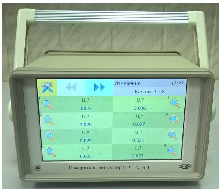
Рисунок 4 - Общий вид измерителя-регулятора ИРТ-4 /16-T